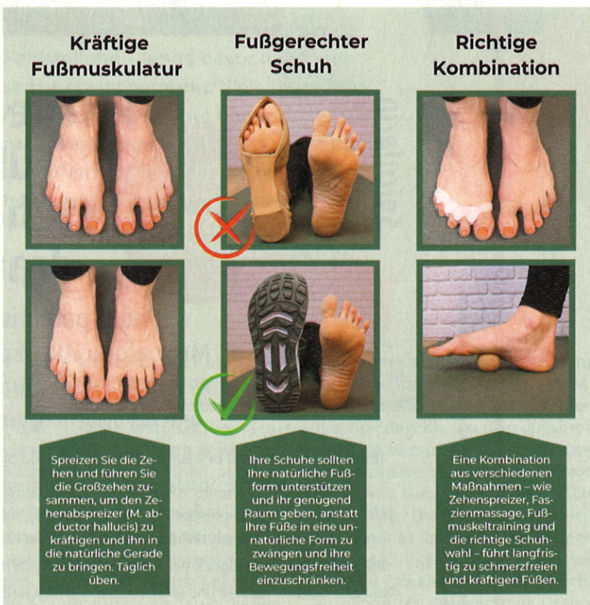
Drei effektive Tipps gegen Hallux valgus: Fußmuskulatur stärken, fußgerechte Schuhe tragen und eine Kombination aus verschiedenen Maßnahmen nutzen.

übungen unterstützen ebenfalls, reichen aber allein nicht aus. Erst in Kombination mit der aktiven Kräftigung der Fußmuskulatur und einer fußgerechten Schuhwahl entfalten sie ihre volle Wirkung. Dieses Zusammenspiel hilft,