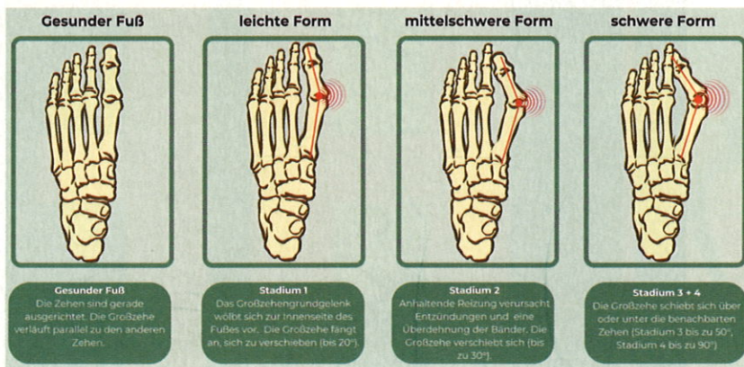
Hallux-valgus-Stadien – von einem gesunden Fuß bis zur schweren Fehlstellung. Die Abbildung zeigt die zunehmende Verschiebung der Großzehe.

hilft gezielte Aufklärung: Absatzschuhe besser für besondere Anlässe reservieren, statt sie täglich zu tragen.